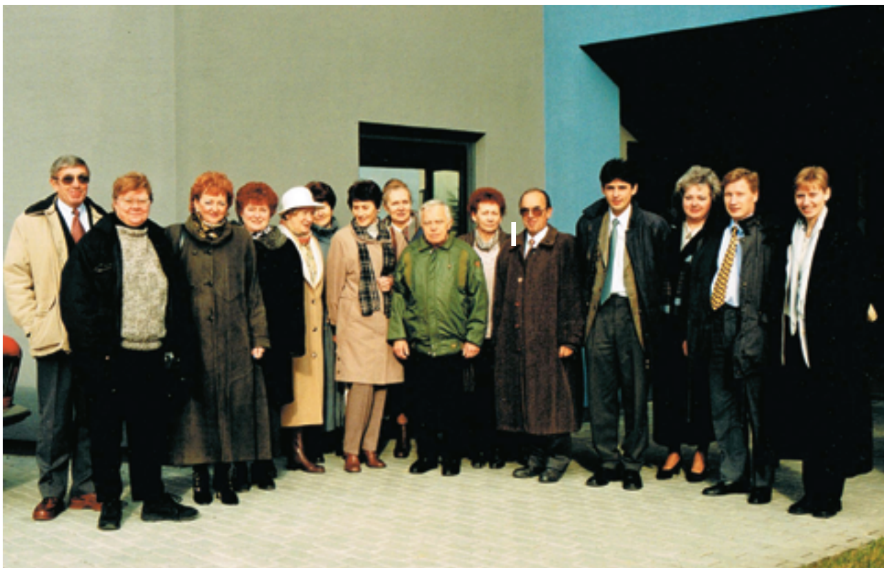
Członkowie Podkarpackiej Okręgowej Rady Aptekarskiej z przedstawicielami ICN Polfa - Rzeszów S.A. (12.XI.1998 r.)

Wprowadzono waloryzację taksy aptekarskiej – dalej kwota za wykonanie leku złożonego w aptecę zbliżona jest do odpłatności za wykonanie najprostszej czynności rzemieślniczej.