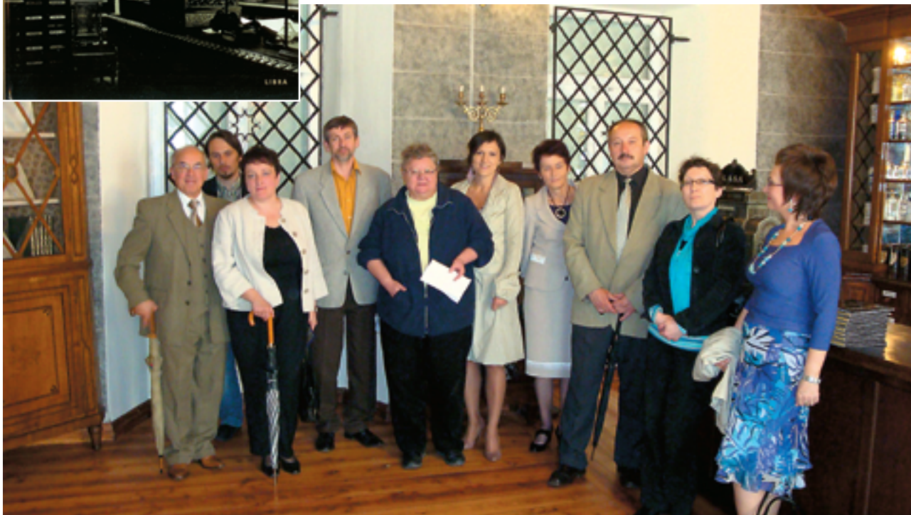
Członkowie Prezydium w sali wystawowej Muzeum

Postanowiono też wystąpić do dyrekcji Muzeum Budownictwa Ludowego w Sanoku z prośbą o informację o stanie odtworzenia „rynku miasteczka galicyjskiego”, na którym ma się znaleźć również apteka.