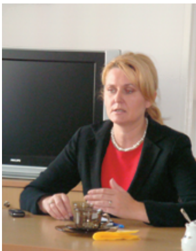
E. Łukacijewska (obecnie poseł do Parlamentu Europejskiego)

Na posiedzenia PORA zapraszano posłów na Sejm RP. Pierwszą wizytę złożyła, w dniu 9 maja 2005 roku, Elżbieta Łukacijewska, która w Sejmie RP złożyła interpelację w sprawie dostosowywania lokali aptecznych do wymogów ustawy Prawo Farmaceutyczne.