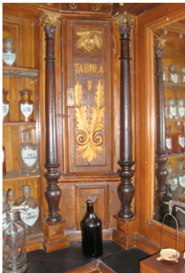
Ekspozycja aptekarska w Muzeum Ziemi Bieckiej