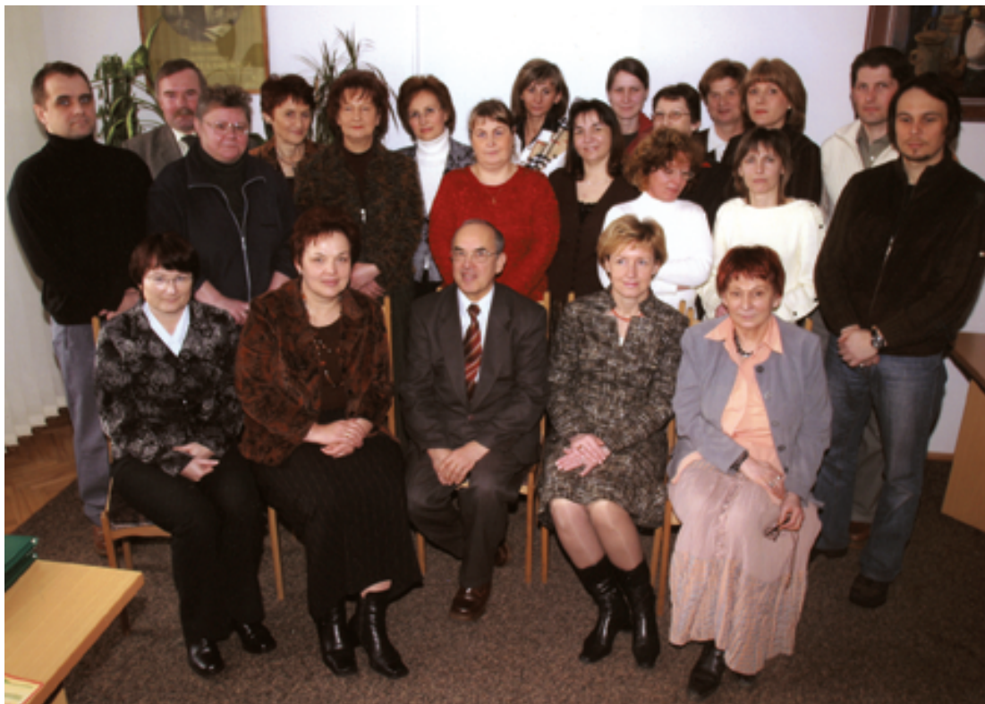
Członkowie Rady i Prezydium IV kadencji oraz pracownicy biura