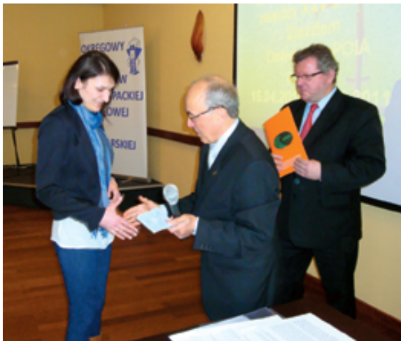
Prezisi (NRA i PORA) wręczają Prawo Wykonywania Zawodu