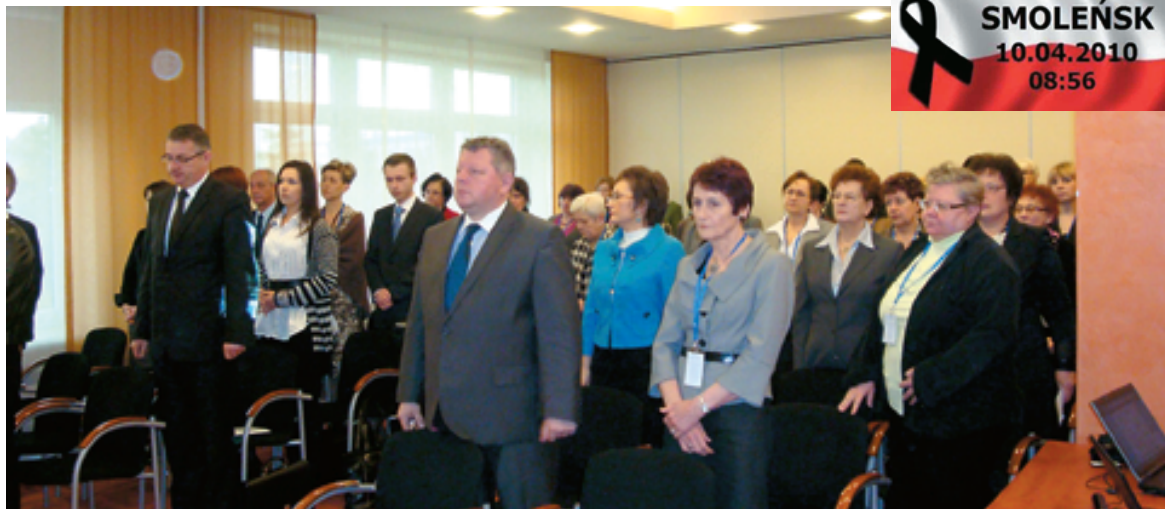
Delegaci na Zjazd minutą ciszy uczcili poległych w katastrofie

XXV Okręgowy Zjazd Delegatów Podkarpackiej Okręgowej Izby Aptekarskiej, 15. IV. 2010, Rzeszów, Sala Konferencyjna Hotelu „Prezydencki”.