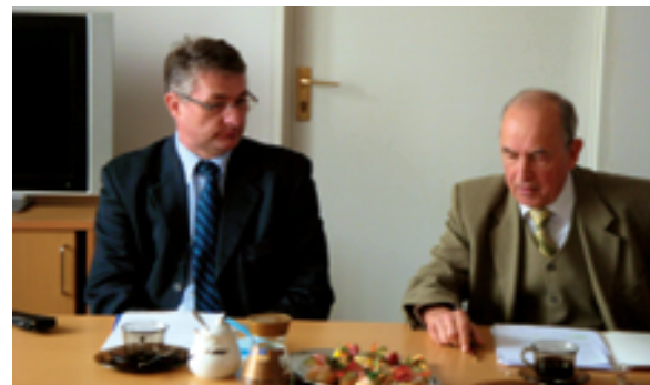
Z lewej Poseł na Sejm RP Marek Rząsa