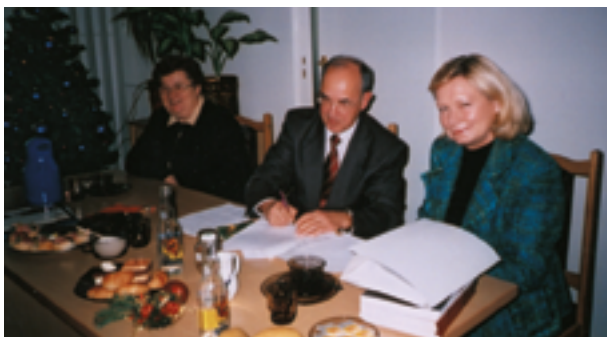
Podpisanie umów w sprawie organizacji szkoleń ciągłych (Iwonicz Zdrój, Rzeszów)

21 sierpnia 2004 roku, w Iwoniczu-Zdroju, została podpisana dwustronna umowa w sprawie organizacji szkoleń ciągłych dla farmaceutów między Akademią Medyczną im. F. Skubiszewskiego w Lublinie jako jednostką szkolącą a PORA jako jednostką realizującą. Analogiczna umowa została podpisana w siedzibie POIA w dniu 10 grudnia tego samego roku pomiędzy PORA a Wydziałem Farmaceutycznym Collegium Medicum Uniwersytetu Jagiellońskiego.