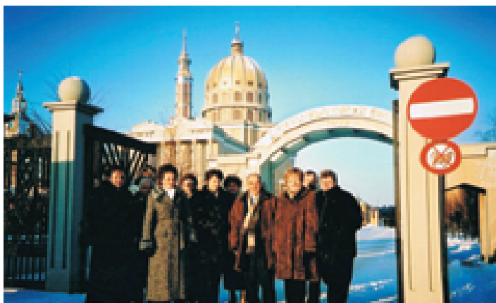
Delegaci POIA przed Katedrą Licheńską ...