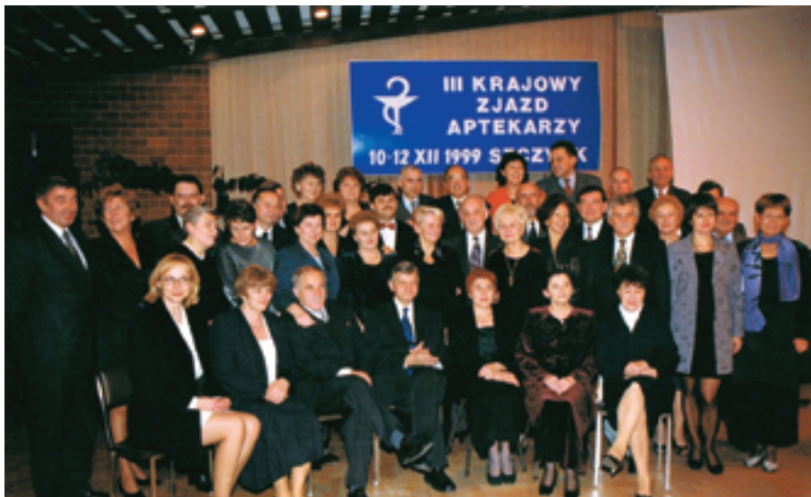
Nowo wybrana Naczelna Rada Aptekarska

III Krajowy Zjazd Aptekarzy odbył się w Szczyrku, w hotelu „Orle Gniazdo” ze wspaniałym widokiem na Beskidy. Na podziwianie gór czasu jednak nie było. Dwa i pół dnia obrad całkowicie (poza wyborem nowych władz) wypełniła dyskusja nad strategią i polityką, jaką należy prowadzić dla dobra środowiska i zawodu aptekarskiego.