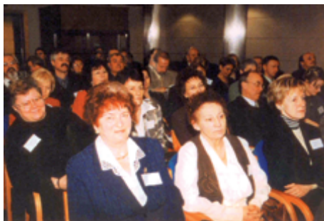
Delegaci POIA na sali obrad