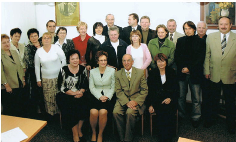
PORA wybrana na Zjeździe