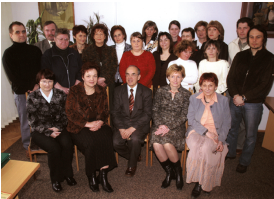
PORA IV KADENCJI wybrana na Zjeździe