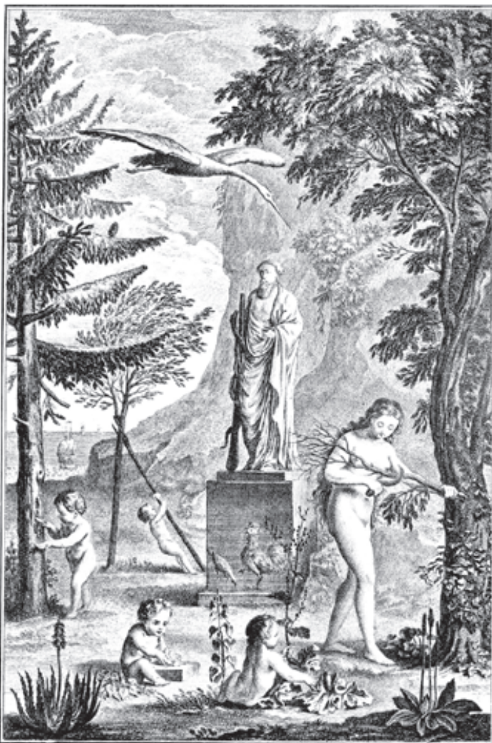
Tischb. Handbuch der Pharmakognosie. 2. Aufl., Bd. I.